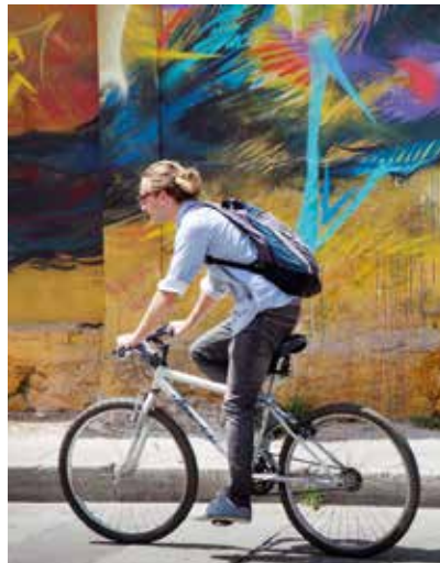
Op zondagochtend is een deel van Medellín en Bogotá autovrij. Rechts: Sfeervol Cartagena.