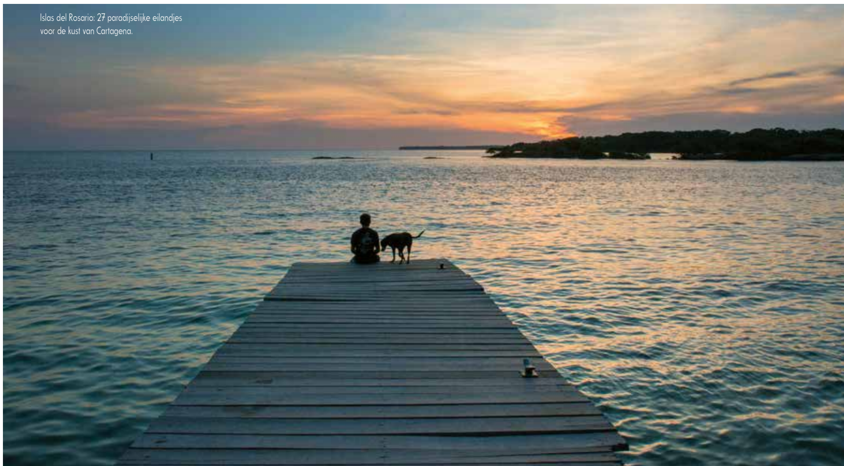
Islas del Rosario: 27 paradijselijke eilandjes voor de kust van Cartagena.

Met presidenten als Alvaro Uribe en zijn opvolger Juan Manuel Santos aan de macht is de drugshandel de laatste vijftien jaar keihard aangepakt en toenadering met de marxistische rebellenbeweging FARC gezocht. Investeerders weten Colombia inmiddels te vinden, wat heeft bijgedragen aan een economie die al jarenlang een van de groei-briljantjes van Zuid-Amerika is. In hun kielzog merken steeds meer toeristen dat het sein op groen is gezet. Want met de veiligheid zit het in de toeristenoorden goed, blijkt ook uit een positief reisadvies van de Nederlandse Rijksoverheid.