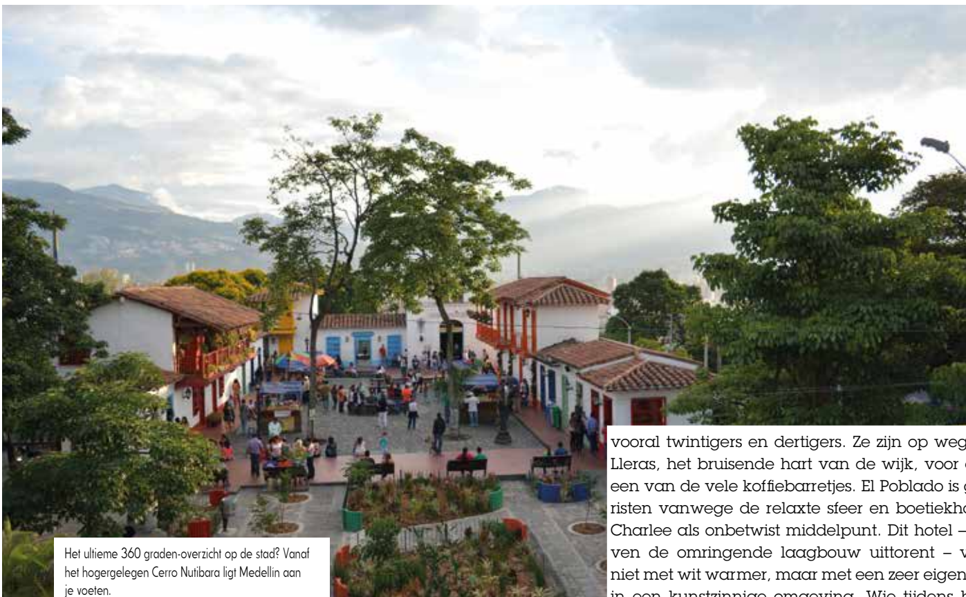
Het ultieme 360 graden-overzicht op de stad? Vanaf het hogergelegen Cerro Nutibara ligt Medellín aan je voeten.